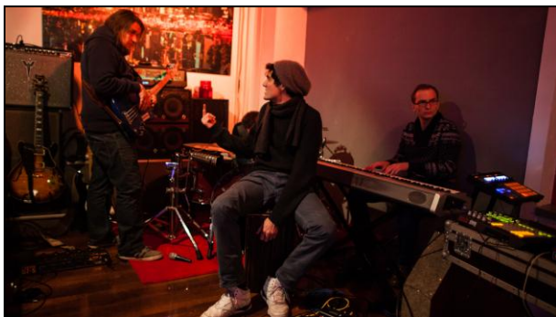
„Das wird eine geile Party!“

„geil“ ist ein Begriff, der von jungen Menschen häufig verwendet wird – das allerdings bereits seit den 1980er Jahren. Eigentlich stammt das Wort aus der Botanik. Im 15. Jahrhundert wurde es verwendet, um besonders gerade gewachsene Bäume zu beschreiben. Später bekam es eine sexuelle Konnotation und bedeutete „sexuell erregt“. Wer heute das Wort verwendet, meint meist, dass etwas „cool“, „super“ oder „sehr gut“ ist. Auch in der Werbung oder in Liedtexten wird das Wort immer mehr verwendet. Trotzdem sollte man darauf achten, in welchen Situationen man es sagt: Ebenso wie das Wort „scheiße“ gehört es zur Umgangssprache.