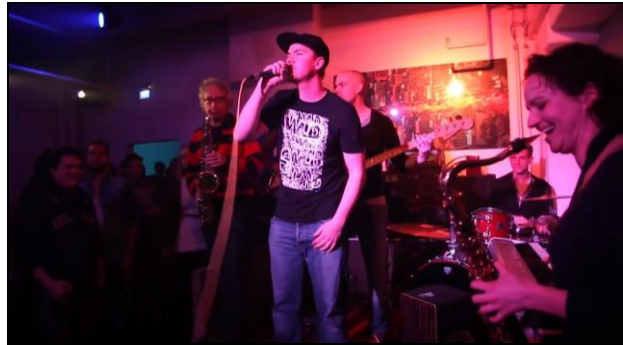
Jamsessions machen Spaß – und bringen Ideen für neue Songs

„Jammen“ ist ein Begriff aus dem Jazz und bezeichnet das gemeinsame Improvisieren oder Spielen bekannter Melodien. Bereits in den 1940er Jahren trafen sich Jazz-Musiker zu sogenannten Jamsessions. Dadurch bekam die Jazzmusik neue Impulse. Heute wird der Begriff auch in anderen Musikrichtungen verwendet, z. B. im Hip-Hop. Dabei spielen die Musiker gemeinsam auf der Bühne oder treten in einer Art Wettbewerb gegeneinander an (das nennt man dann einen „Battle“). Diese Jamsessions trugen auch dazu bei, dass sich in Deutschland eine richtige Hip-Hop-Community entwickelt hat.