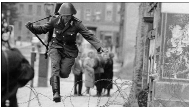
Volkspolizist Conrad Schumann springt am 15.8.1961 über die Grenzanlage in Berlin und flieht in den Westen

Eine Flucht aus der DDR war sehr riskant, da die Grenzen streng bewacht wurden. Trotzdem entschlossen sich immer wieder DDR-Bürger zur Flucht. Sie versuchten, in den Westen zu gelangen, indem sie z. B. Autos umbauten und sich darin versteckten oder Tunnel unter der Mauer hindurch gruben. Es wird geschätzt, dass mehr als 1 000 Menschen bei ihren Fluchtversuchen ums Leben kamen.