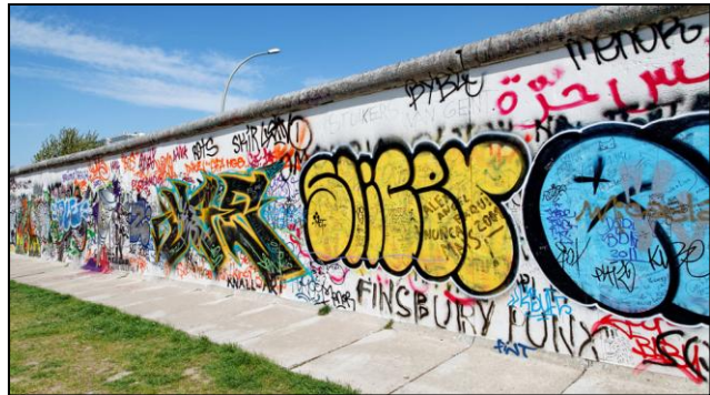
Die Berliner Mauer

Nach Ende des Zweiten Weltkriegs wurde Deutschland unter den alliierten Truppen aufgeteilt. Die USA, Großbritannien und Frankreich verwalteten die westlichen, die Sowjetunion die östlichen Besatzungszonen. Auch Berlin wurde in vier Sektionen unterteilt. 1949 wurden alle westlichen Gebiete in Deutschland vereinigt. Die Bundesrepublik Deutschland (BRD) wurde gegründet. In der sowjetischen Besatzungszone entstand die Deutsche Demokratische Republik (DDR). Die Rechte der Menschen dort wurden durch die sozialistische Regierung eingeschränkt. So durften sie zum Beispiel nicht ohne Erlaubnis in den Westen reisen. Um die Menschen in Ostberlin daran zu hindern „rüberzumachen“ (umgangssprachlich für „nach Westberlin gehen“), wurde im August 1961 die Mauer gebaut. Diese teilte die Stadt in zwei Teile. 1989 kam es in der DDR zu Protesten, Demonstrationen und Massenfluchten, die schließlich zur Öffnung der Grenzen am 9. November führte. Seit 1990 sind die beiden deutschen Staaten wiedervereinigt. Jedes Jahr am 3. Oktober feiert man in Deutschland den „Tag der Deutschen Einheit“.