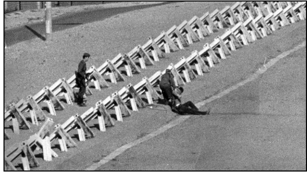
Todesstreifen an der innerdeutschen Grenze zwischen Thüringen und Bayern

Auf DDR-Gebiet, entlang der Grenze zwischen Ost- und Westdeutschland, befand sich eine Fläche, die „Todesstreifen“ genannt wurde. Sie war zehn Meter breit und zum Teil mit Minen ausgelegt. Es gab auch Selbstschussanlagen, die automatisch auf jeden schossen, der auf das Gelände ging. Hinter dem Todesstreifen lag eine weitere Fläche, die von DDR-Soldaten streng kontrolliert wurde. Auf diesem Bild sieht man den ehemaligen Todesstreifen an der innerdeutschen Grenze zwischen Thüringen und Bayern.