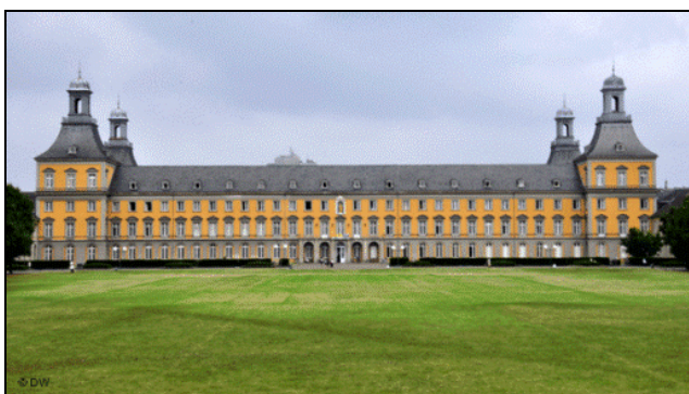
Der Bonner Hofgarten, in dem 300.000 Menschen 1981 gegen atomare Aufrüstung demonstrierten

Als Bonn Hauptstadt der BRD war, fanden viele Demonstrationen im Bonner Hofgarten statt. Eine der bekanntesten Demos war die Friedensdemonstration im Jahre 1981. Etwa 300.000 Menschen nahmen damals daran teil – bis dahin die größte Friedensdemonstration in der BRD. Sie demonstrierten gegen die atomare Aufrüstung und forderten ein Europa ohne Atomwaffen. Trotz der Angst, dass es bei einer solchen Großdemonstration zu Gewaltausbrüchen kommen könnte, verlief sie friedlich. Sie war die erste von mehreren Großdemonstrationen der 1980er-Jahre.