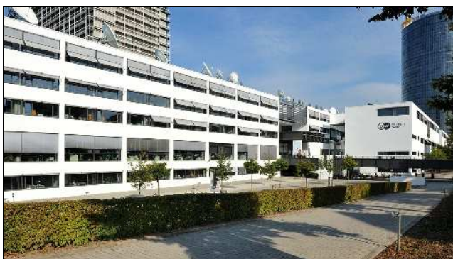
Der Schürmann-Bau: heute Sitz der Deutschen Welle

Eigentlich war der Schürmann-Bau in den 1980er-Jahren für die Abgeordneten des Deutschen Bundestags geplant. Er ist nach seinem Architekten Joachim Schürmann benannt. 1989 begann der Bau des Gebäudes. Doch als Berlin zur Hauptstadt wurde, zog auch der Bundestag nach Berlin. Durch ein Hochwasser des Rheins wurde der noch nicht fertiggestellte Schürmann-Bau 1993 bis zu 70 Zentimeter angehoben und ungleichmäßig abgesetzt, was Schäden am Gebäude zur Folge hatte. Nach langer Überlegung, ob man das Haus abreißen soll, entschied man sich doch für eine Sanierung. Seit 2002 ist das Gebäude der Sitz der Deutschen Welle in Bonn.