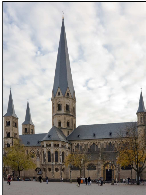
Das Bonner Münster ist eines der Wahrzeichen der Stadt und liegt zentral am Münsterplatz in der Innenstadt

Bonn liegt im Süden von Nordrhein-Westfalen und ist mit über 309.000 Einwohnern die neunzehntgrößte Stadt Deutschlands. Zudem ist sie eine der ältesten Städte des Landes, denn Bonn existiert schon seit mehr als 2000 Jahren. Von 1949 bis 1990 war Bonn die Hauptstadt der BRD. Die Universität Bonn gehört zu den angesehensten Universitäten in Deutschland. Sie wurde 1818 gegründet und hat zurzeit mehr als 31.000 Studenten. Daneben gibt es in Bonn auch unzählige Kulturangebote. Als Geburtsstadt von Beethoven spielt Musik hier eine sehr große Rolle. Das jährliche Beethovenfest ist international bekannt. Auch an Museen hat Bonn ein Menge zu bieten: Allein in der Museumsmeile findet man 5 große Museen, darunter das „Haus der Geschichte“ und die „Kunst- und Ausstellungshalle der BRD“.