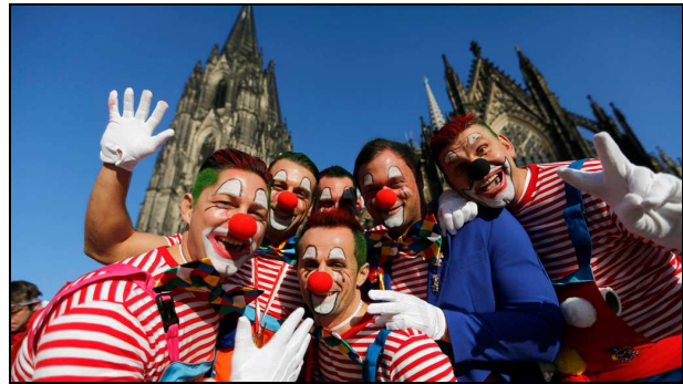
Die Narren sind überall!

In Deutschland gibt es nicht nur vier, sondern auch noch eine fünfte Jahreszeit. Je nachdem, wo man sich in Deutschland befindet, wird sie Karneval, Fasching, Fas(t)nacht, Fastelovend, Faslam, Fasteleer, Fassenacht oder Fasnet genannt. In den meisten Regionen beginnt die „nährische Zeit“ nach dem 6. Januar und dauert bis zur Fastenzeit 40 Tage vor Ostern. Im Rheinland (in der Gegend um Köln, Düsseldorf und Aachen) beginnt der Karneval bereits am 11. November um 11:11 Uhr zunächst mit Karnevalsveranstaltungen, die dann im Februar oder März mit einem Straßenkarneval enden. Die Tradition, Karneval zu feiern, ist in Deutschland sehr alt. Bereits im Mittelalter wurde die Zeit vor der Fastenzeit ausgelassen gefeiert.