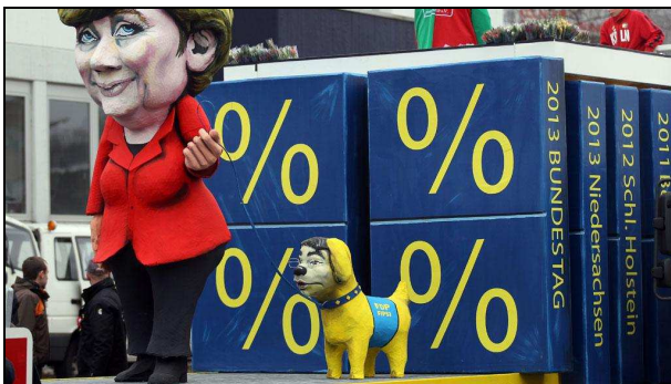
Zielscheibe der Kritik im Karneval: Politiker – hier Bundeskanzlerin Angela Merkel

Ein Höhepunkt der Karnevalszeit sind die Karnevalsumzüge, die kurz vor Beginn der Fastenzeit stattfinden. Bunte Wagen der Karnevalsvereine fahren durch die Straßen, begleitet von Blaskapellen und Karnevalsgruppen. In manchen Städten gibt es auch so genannte Motivwagen, die sich auf satirische Weise mit aktuellen politischen Ereignissen auseinandersetzen. Die Bürger der Stadt stehen während des Umzugs am Straßenrand und bekommen Bonbons – in Köln „Kamelle“ – und andere Dinge zugeworfen. Im Jahr 2013 wurden in der so genannten Karnevalshochburg Köln 150 Tonnen Süßigkeiten verteilt.