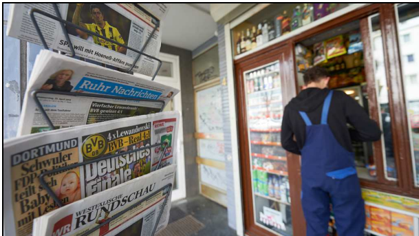
Durst nach Ladenschluss? Auf zum Büdchen!

„Büdche“ nennt man in der Gegend um Köln einen Kiosk oder kleinen Laden. Hier kann man oft auch nach Ladenschluss und an Sonn- und Feiertagen Getränke, Zeitungen, Zigaretten und Süßigkeiten kaufen. Manche Büdchen bieten auch Pommes Frites oder Bratwurst an.